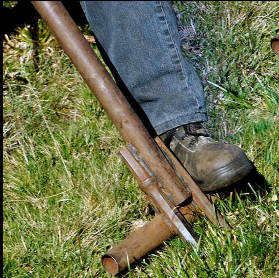
LA FOURCHE DU DIABLE ... NIKON D700- 1/250°f 11 à 200 ISO Octobre 2017