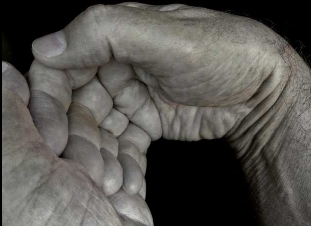
2011, Boulogne-Billancourt, France, hands (R)