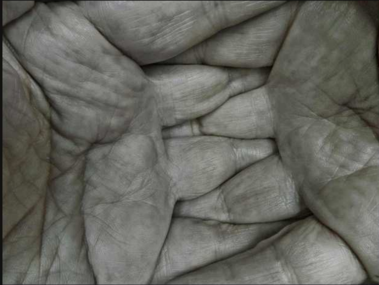
2011, Boulogne-Billancourt, France, hands (Y)