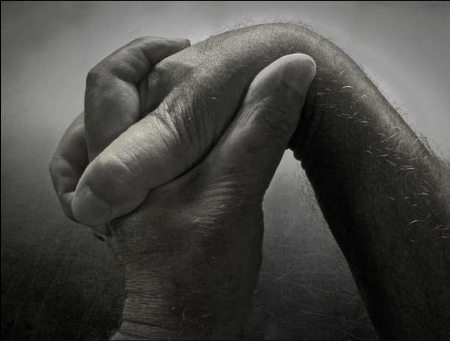
2011, Boulogne-Billancourt, France, hands (A)